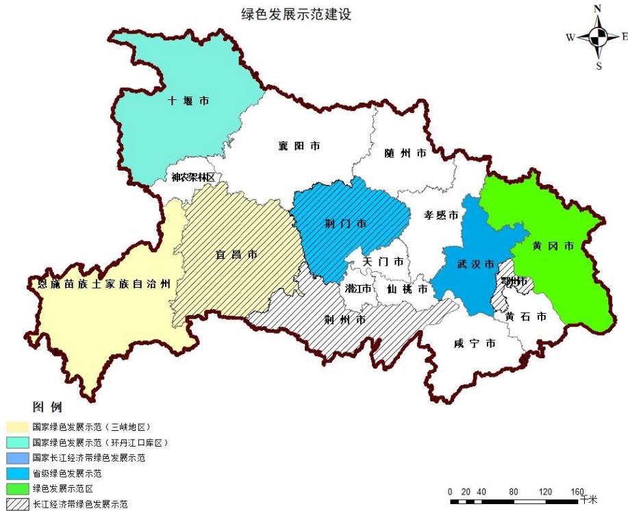
图 2 湖北省长江经济带绿色发展示范建设空间布局图

围绕流域水环境、跨流域调水、主体功能区、林业碳汇等多元化生态补偿内容，完善资金补偿、产业转移、人才培养、园区共建等市场化、多元化横向补偿机制，在大别山区、秦巴山区、武陵山区、幕阜山区开展横向生态补偿试点。完善纵向生态保护补偿制度，参照生态产品价值核算结果、生态保护红线面积等因素，完善重点生态功能区转移支付资金分配机制。